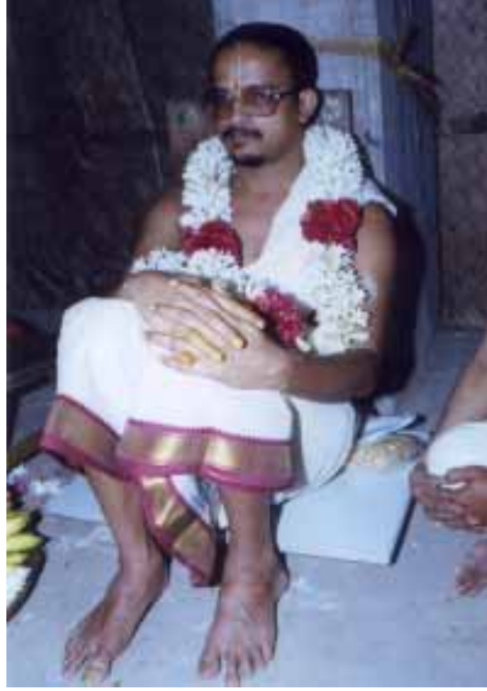
ஸ்ரீ ஸ்வாமிகளின் ஜெயந்தி சிறப்பிதழ்