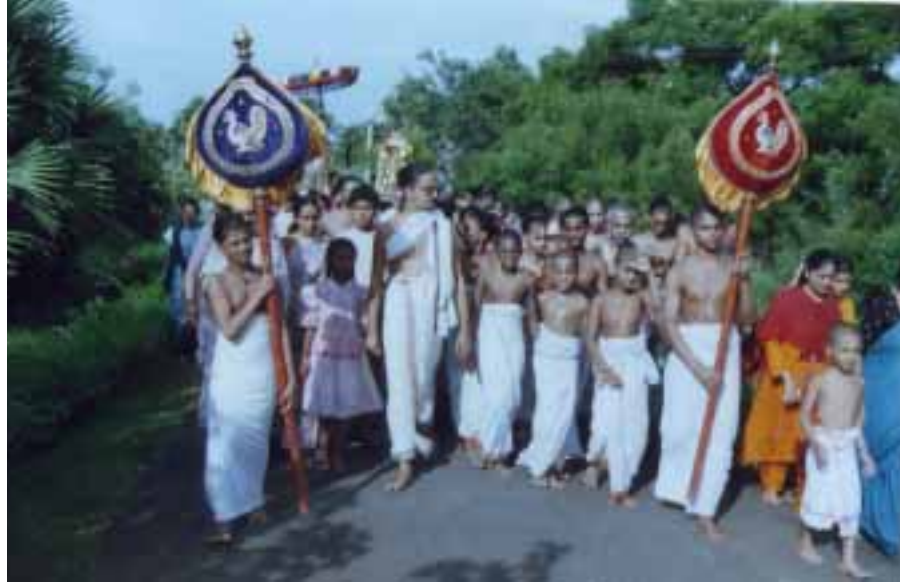
ப்ரஹ்மோத்ஸவத்தில் நகர ஸங்கீர்தனத்தில் ஸ்ரீ ஸ்வாமிகள்.